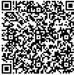
Рисунок 7 — Сценарий тематической викторины с примерами вопросов

В каждом из перечисленных мероприятий важно отслеживать активность участников, высказываемыми ими мнения, их настрой в целом. На таких мероприятиях необходимо присутствие психолога для фиксации активности и оценки их поведения.